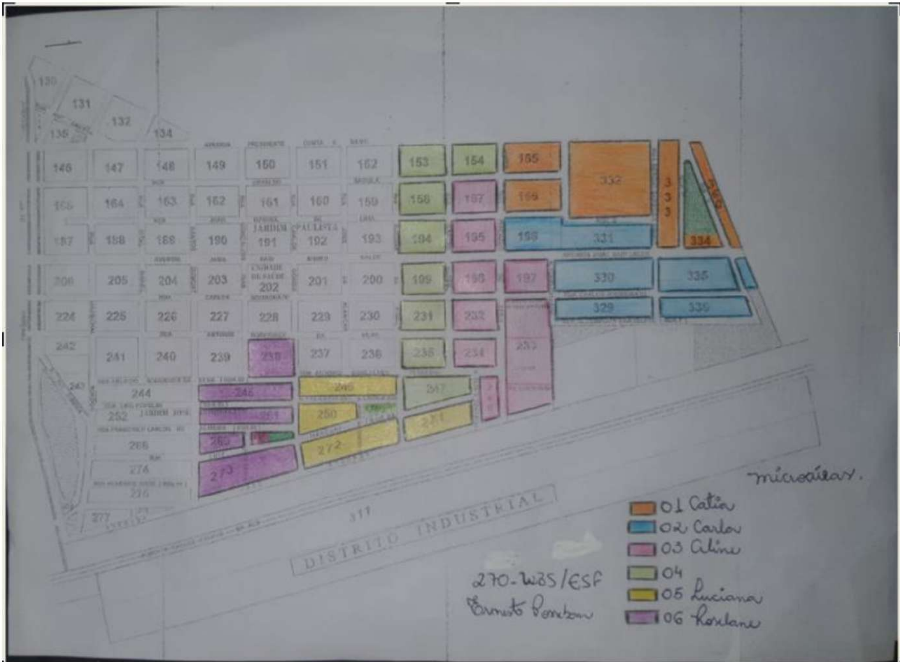
EQUIPE SAÚDE NO BAIRRO, ESF III ERNESTO POSSEBOM